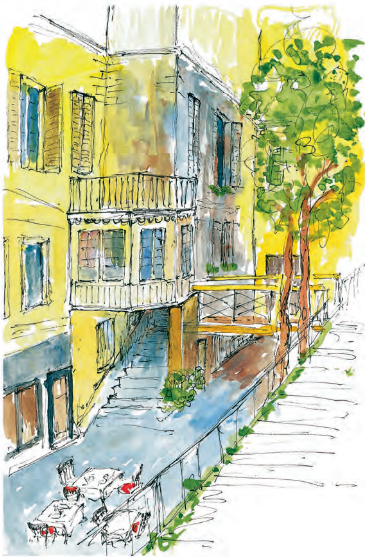
La Petite Cour rue Mabillon