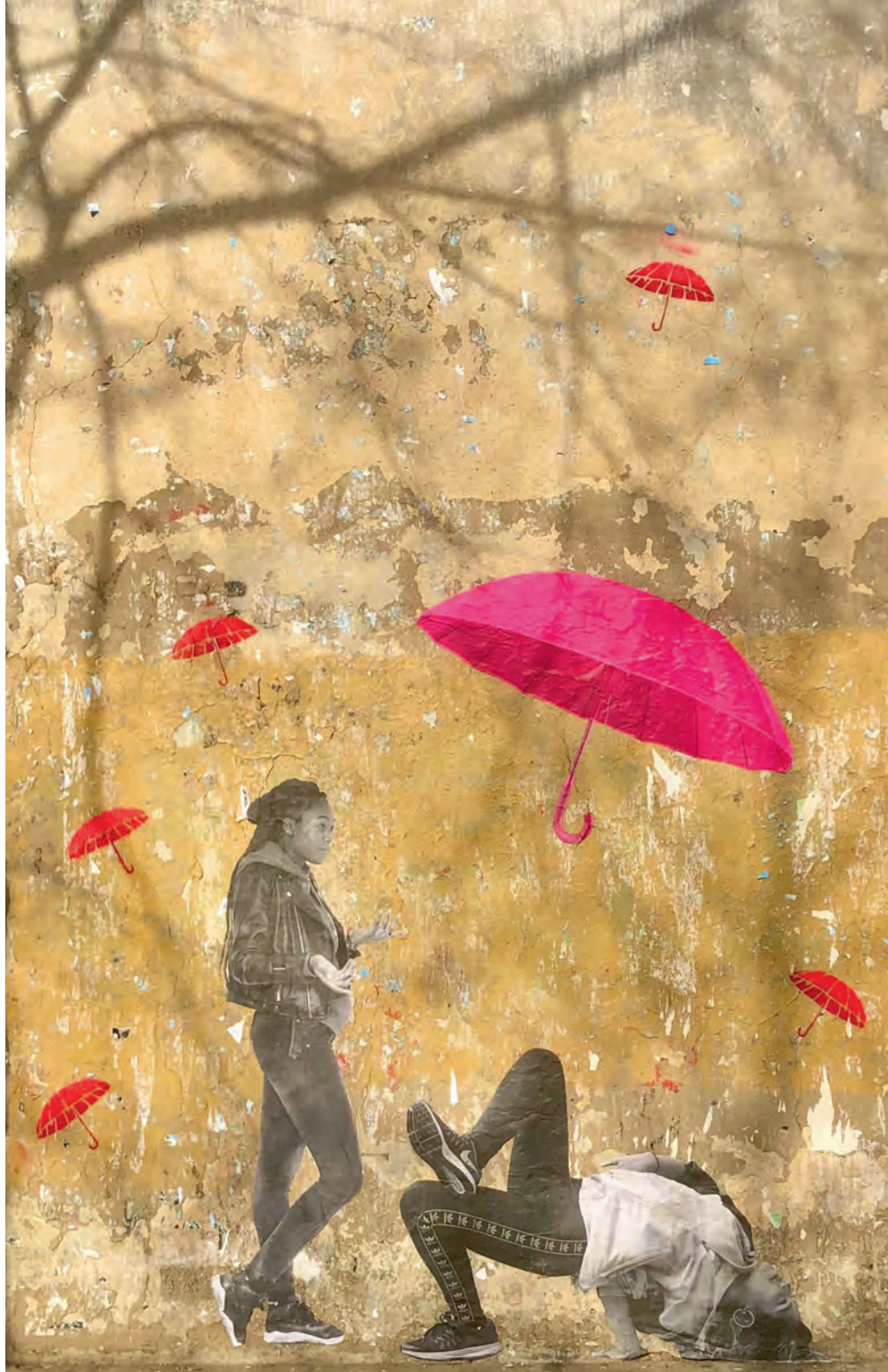
Muurschildering in de Marais