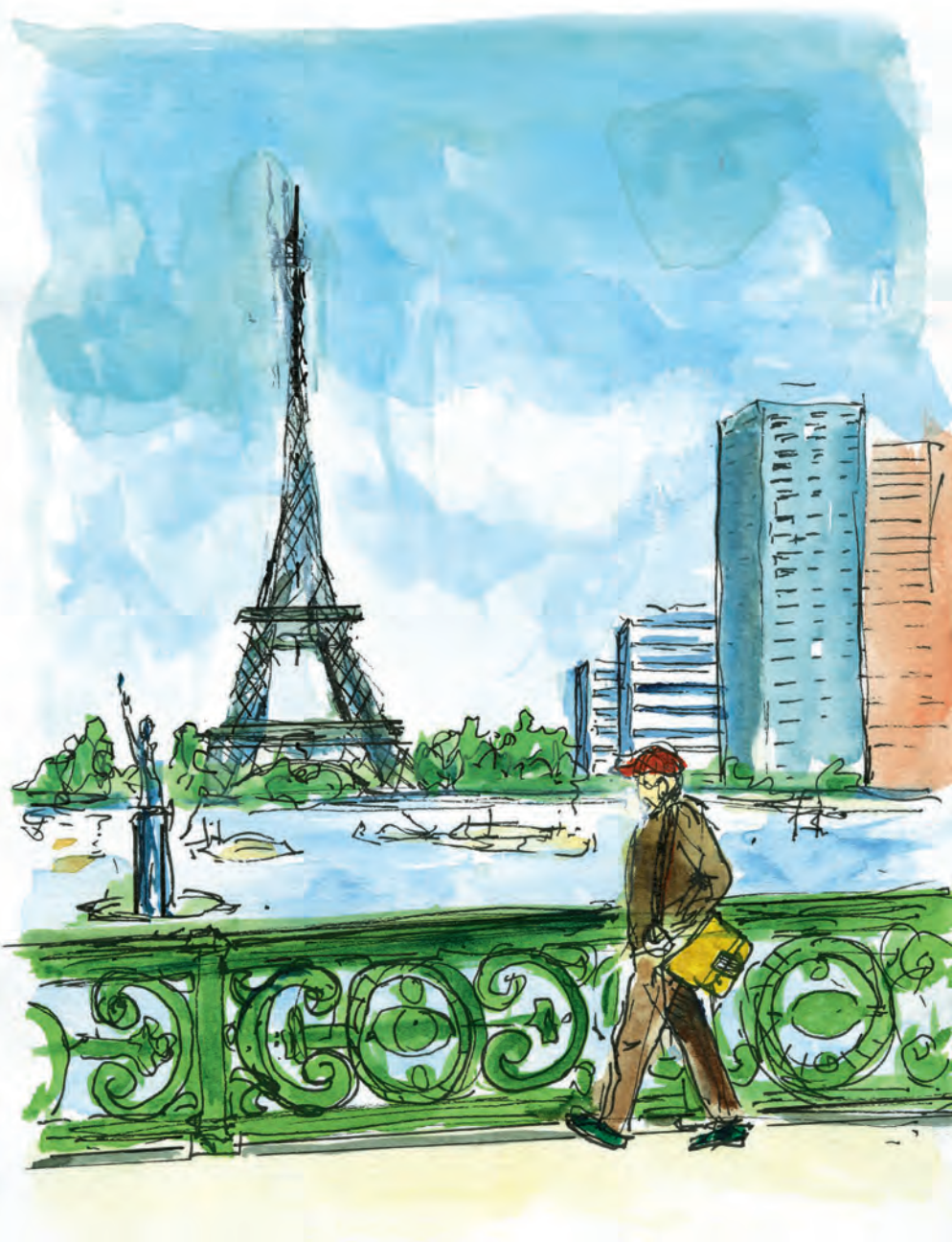
De Eiffeltoren vanaf de Pont Mirabeau