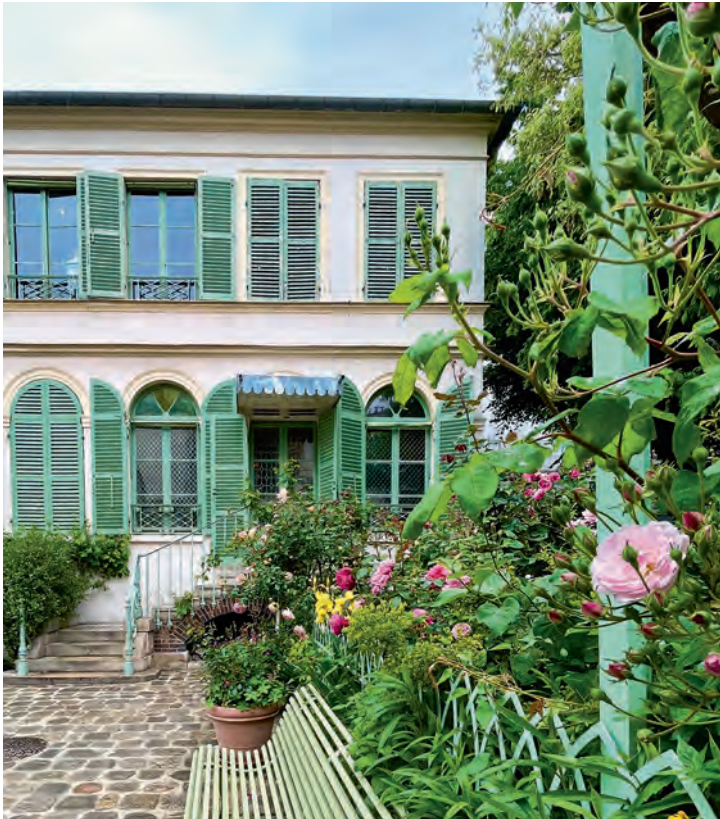
Musée de la Vie Romantique