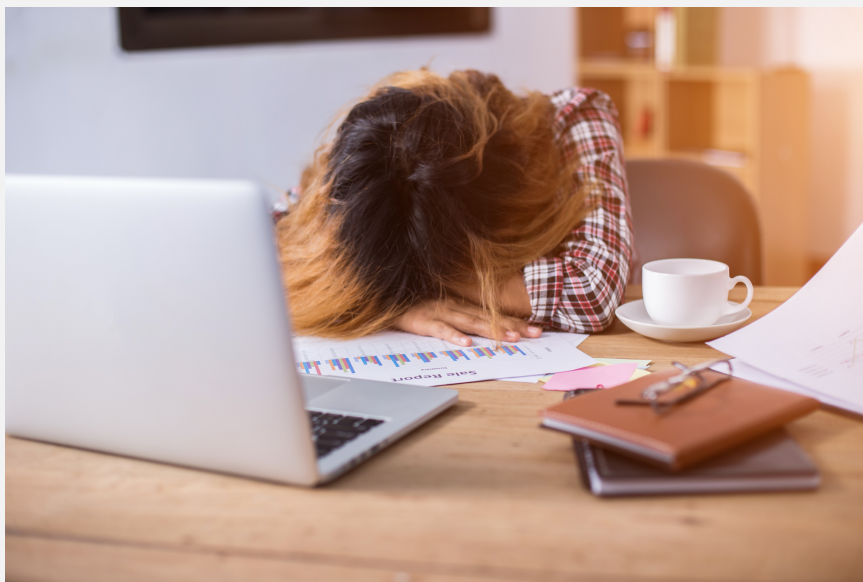
Langere tijd veel stress kan leiden tot een burn-out.