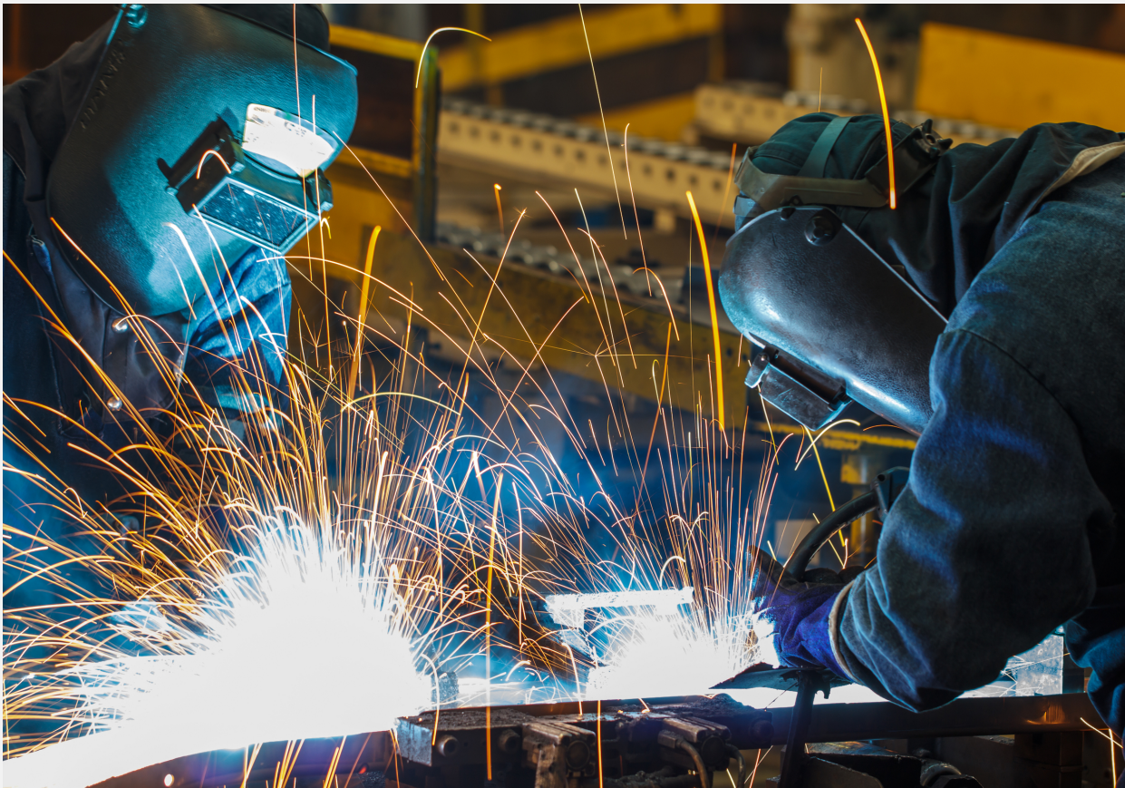
Beschermende kleding is soms verplicht.

Om veilig te werken heb je soms persoonlijke beschermingsmiddelen (PBM's) nodig. Deze middelen verminderen de kans op letsel. Voorbeelden hiervan zijn werkschoenen, een helm, handschoenen, beschermende kleding, mondkapjes en gehoorbescherming. Je leidinggevende geeft aan wanneer en hoe je deze middelen moet gebruiken. Soms is het alleen een advies, maar vaker is het verplicht om de PBM's te gebruiken. Bij geluid boven 85 dB(A) moet je bijvoorbeeld gehoorbescherming gebruiken. Werk je met giftige stoffen, dan is beschermende kleding verplicht.