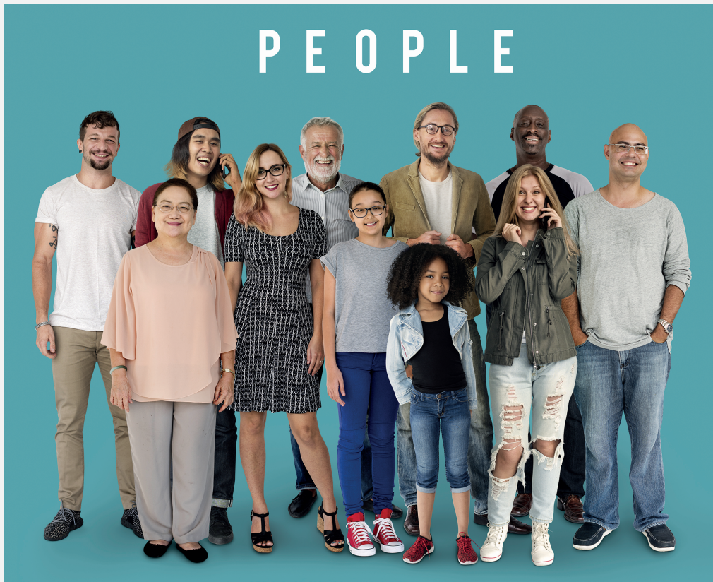
In de zorg krijg je te maken met allerlei verschillende mensen.