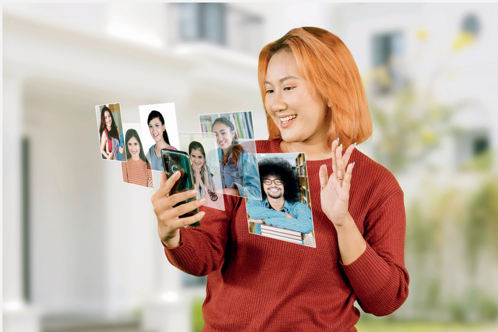
Je netwerk bestaat uit alle mensen die jij kent.

Misschien wist je het niet, maar jij netwerkt! Je houdt contact met je vrienden en familie. Jouw zakelijke netwerk bestaat bijvoorbeeld uit medestudenten of collega's. Je 'onderhoudt' je netwerk . Dit betekent dat je moeite doet om het contact goed te houden. Je hebt veel aan je netwerk: je kunt bijvoorbeeld om hulp vragen, kennis delen of een nieuwe baan vinden.