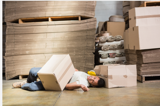
De Arbowet is er om de veiligheid op de werkvloer te vergroten.

De regels op je werk veranderen regelmatig. Bijvoorbeeld omdat de Arbowet aangepast is. Maar bijvoorbeeld ook omdat het bedrijf verhuist of er andere werkzaamheden bijkomen. Zo zorgt je werkgever ervoor dat de regels blijven passen bij de organisatie, de werkzaamheden, de medewerkers en de klanten. De werkgever zal je informeren over de nieuwe regels. Ben je langer afwezig geweest door bijvoorbeeld vakantie of ziekte, vraag dan zelf of alle regels nog hetzelfde zijn.