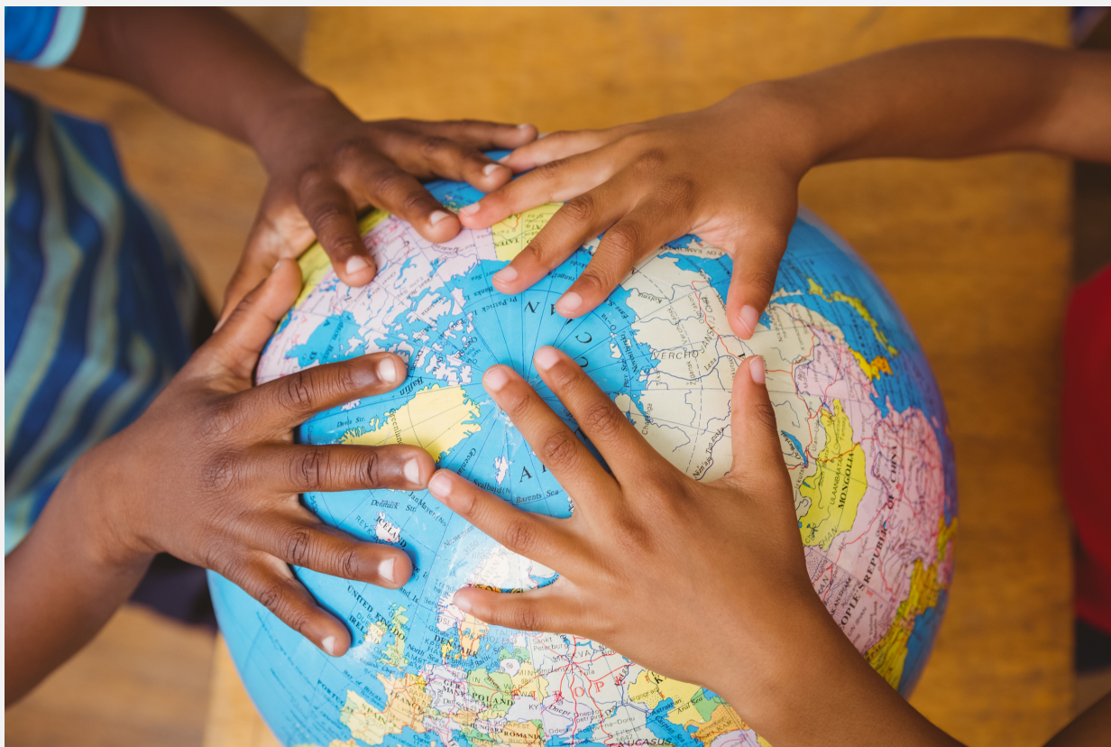
In verschillende landen worden VVE-projecten uitgevoerd.

In Nederland kun je de extra ondersteuning voor doelgroepkinderen in drie periodes verdelen: vóór 2000, na 2000 en vanaf 2010.