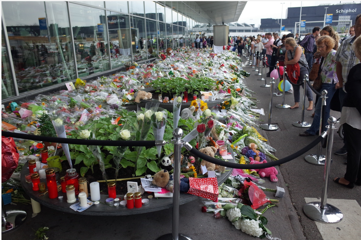
Onze rechtsorde was geschokt na de aanslag op vlucht MH17 op 17 juli 2014.

Daarmee komen we bij het doel van het strafrecht. Het doel van het strafrecht is de rechtsorde te beschermen. Met de rechtsorde wordt bedoeld: de veiligheid en de rust in de samenleving.