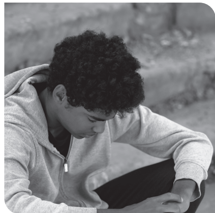
Figuur 1.1 In zichzelf gekeerde jongere

Vanaf het begin van deze eeuw zien we steeds meer beschrijvingen van jongeren over zichzelf. We zien dat sommige jongeren tamelijk snel veranderen, zelfs voor hun directe omgeving. Hierna geven we voorbeelden van de manier waarop jongeren hun belevingswereld beschrijven. Dit geeft een goede indruk van wat er bij hen leeft.