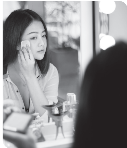
Figuur 1.2 Jongere experimenteert met identiteit (met het thema 'beauty en fashion' trekken influencers veel volgers)