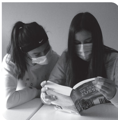
Figuur 1.3 Coronatijd: mondkapjes

vinden niet alle veranderingen bij iedereen op dezelfde leeftijd plaats. Er zijn ook meisjes van 11 of 14 jaar die passen binnen de beschrijving van 'meisjes van dertien'. Sommige kinderen zijn 'vroegrijp', of juist 'laatbloeijs'. Ook kan iemand lichamelijk