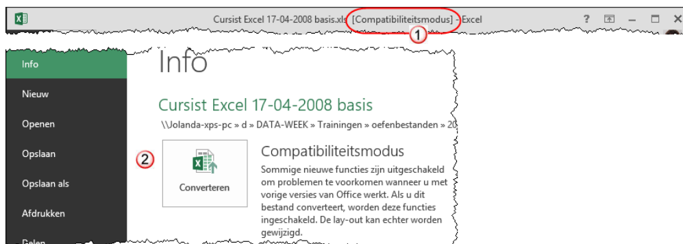
Figuur 2 Een geopend 2003 bestand

<tip>De gebruikers van versie 2003 kunnen een conversieprogramma downloaden van de website van Microsoft ( www.microsoft.nl ), zodat ze documenten die gemaakt zijn met versie 2007, 2010 of 2013 kunnen openen, bewerken en opslaan.