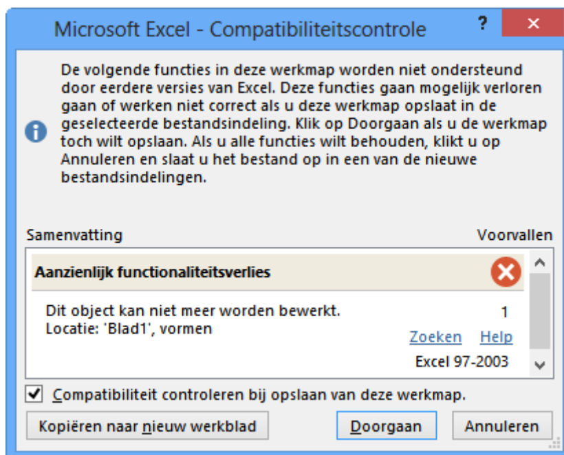
Figuur 4 Excel meldt dat er functioneerverlies is wanneer deze werkmap als een 97-2003-bestand wordt opgeslagen

Werkmappen kunnen echter nieuwe functies bevatten die niet worden ondersteund in de oudere versies. Excel zal dan een melding geven.